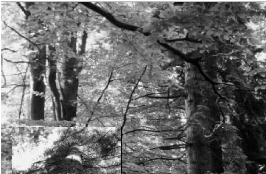
Podrost v karpatském lese