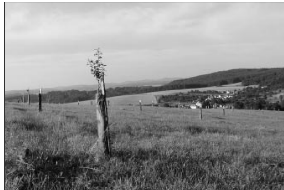
mladé stromky okolo Hostětína

Po úspěchu aukce jsme rozhodnutí ji v dalších letech opakovat s cílem věnovat získané prostředky na výkup ohrožených a přírodně cenných lokalit.