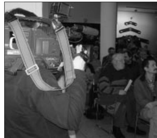
Benefiční aukce v Domě umění města Brna