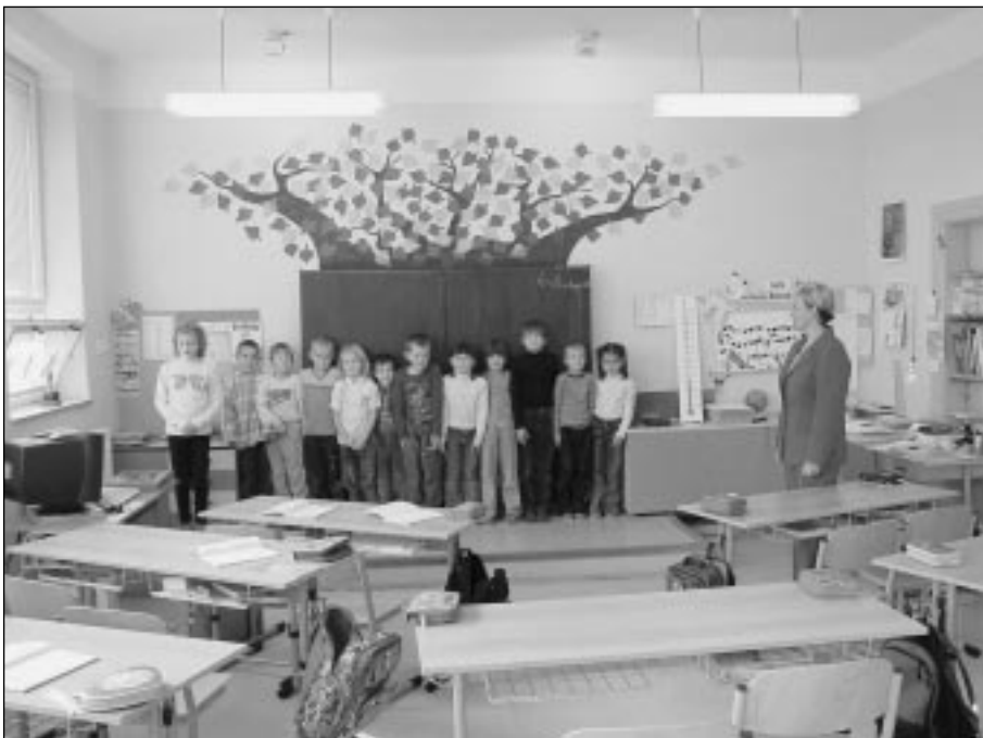
Sdružení Slunečnice, ŠD Olbramice