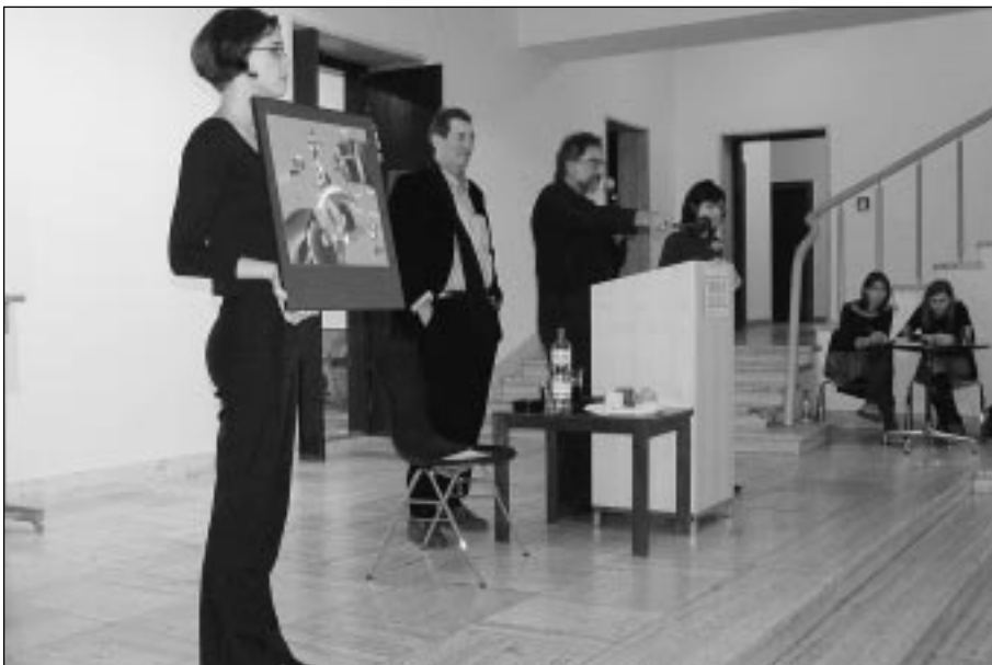
Benefiční aukce v Domě umění města Brna