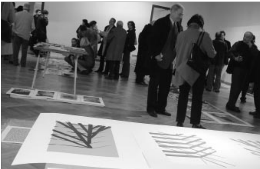
Výběr uměleckých děl na Benefiční aukci v Domě umění města Brna