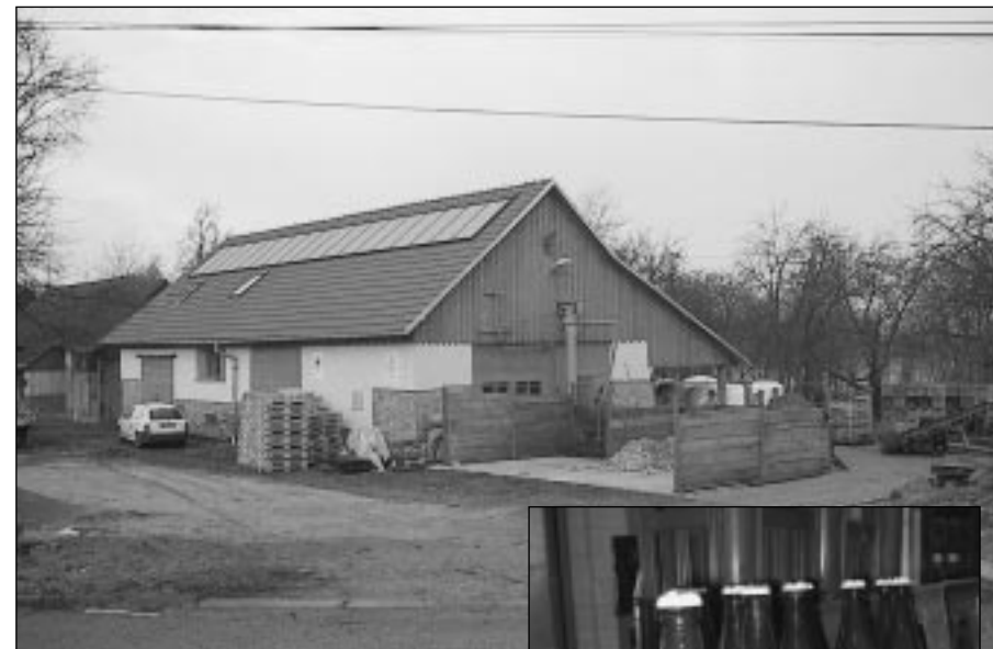
Moštárna v Hostětíně